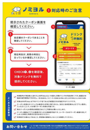
従業員オペレーションマニュアル