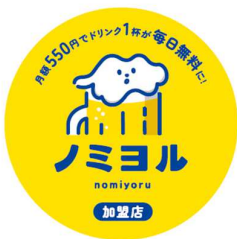
加盟店ステッカー

■ 加盟登録が完了いたしましたら、加盟店であることの周知や店舗オペレーションなどのツールを送付いたします。